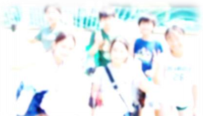
市水泳記録会(7月27日)

講師の先生を招き、子どもたちとのよりよい関わり方について学びました。みんな真剣な表情でした。