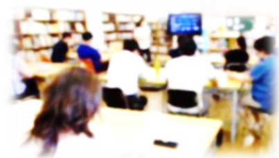
職員も勉強会(7月20日)

講師の先生を招き、子どもたちとのよりよい関わり方について学びました。みんな真剣な表情でした。