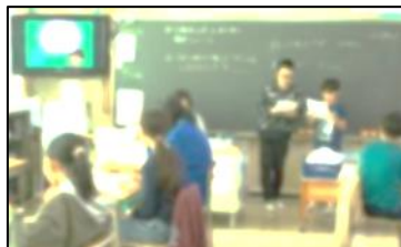
5年生保健委員による紙芝居の発表の様子(6年生の教室)

11/8の「いい歯の日」に合わせて、保健委員が全学級で紙芝居ツアーを実施しました。ほげんだより(11/14発行)でもお知らせしましたが、ツアー最終日、5年生の保健委員が6年生の教室で紙芝居を読み終えた直後、6年生が総立ちで拍手喝采! 5年生はとてもうれしそうでした。6年生が学校を明るく盛り立てていることに、私もとてもうれしくなりました。