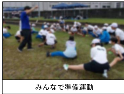
みんなで準備運動

桐生市陸上競技場で、5・6年生の選手が出場しました。6年生は、選手だけでなく、全員が会場に行き、選手たちの応援や手伝いをしました。出場した子供たちは、応援を支えに、もっている力を思う存分発揮して、頑張りました。