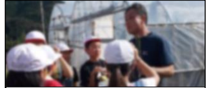
熱心に質問をする子供たち