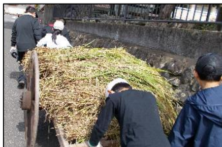
9/25 稲を運んでいる様子