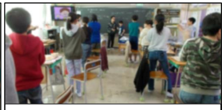
5年生の発表後、6年生が総立ちで拍手喝采! 5年生お疲れ様。6年生ありがとう。