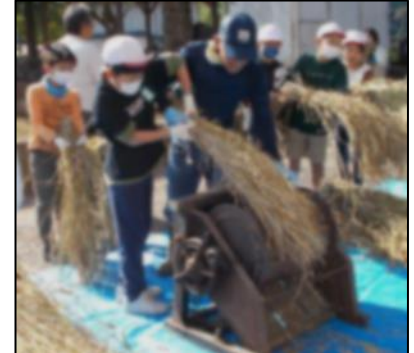
10/27 昔の脱穀作業体験

江戸時代に使用されていた千歯こきを使って、複数の歯でもみ殻を落とす体験をしました。子供たちは、「疲れた〜 難しい〜」と話していました。