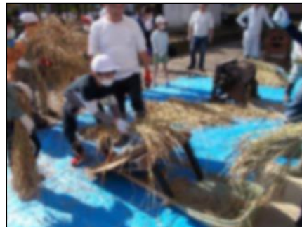
10/27 昔の脱穀作業体験

稲刈り、稲架掛け終了後、お手伝いをしてくださった保護者の皆様と記念撮影をしました。