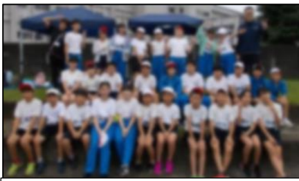
みんなで写真撮影