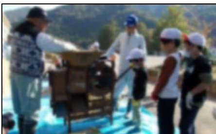
10/27 昔の脱穀作業体験

明治時代から使用されていた足踏み脱穀機を使って、もみ殻をそぎ落とす体験をしました。