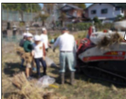
10/27 今の脱穀作業の見学

大正時代から主に使用されていた唐箕を使って、風力で粃や藁くずを選別する体験をしました。