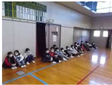
4年生は、来年高学年の仲間入りです。しっかり見学しました。

それぞれの学年が、6年生への感謝の気持ちを込めて、たくさん練習をして、発表してくれました。全校で一緒にお祝いができないことが残念で、申し訳ない気持ちです。「6年生の後輩の面倒見のよさ、在校生の優しい気持ち」は本校の伝統です。6年生の皆さんは、残りの生活を存分に楽しんでください。準備・進行してくれた5年生もありがとうございました。