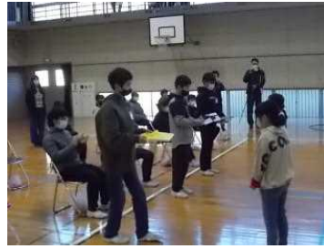
6年生に、在校生全員のお手紙を渡しました。(1年代表から)