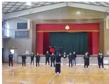
6年生：合唱「変わらないもの」とてもきれいなハーモニーでした。