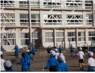
2/8 リズム縄跳び開始