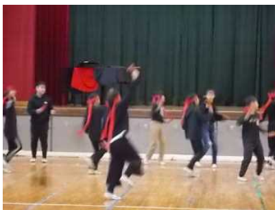
6年生：力強いYOSAKOI SORANを披露しました。