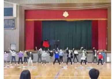
2年生：「みんなが好き」の気持ちが伝わりました。