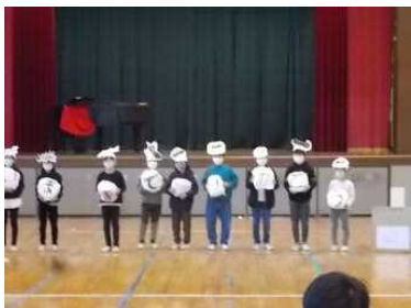
3年生：劇を通して、頑張れとエールの気持ちが伝わりました。