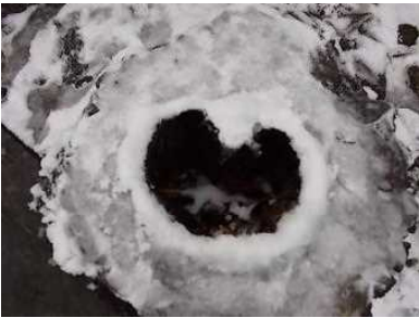
2/10 黒松の切り株が ハートマークに