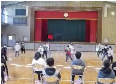
1年生：「ありがとう6年生」の感謝の気持ちが伝わりました。