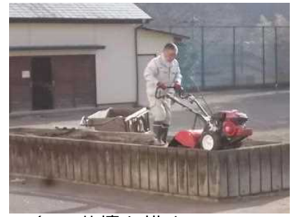
2/8 花壇を耕す （用務員さん）