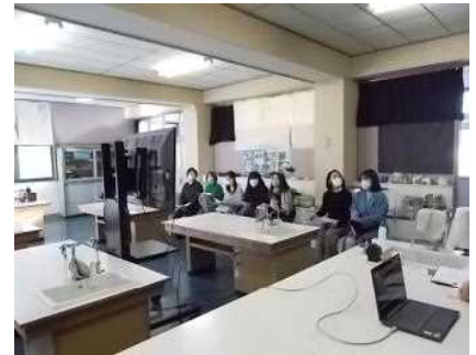
2/14 PTA年度末総会 （オンライン形式）