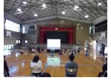
5年生：「5年間一緒に過ごした感謝」の気持ちが伝わりました。