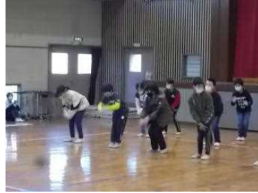
4年生：「チェッコリーダンス対決」を通して、ずっと忘れないという気持ちが伝わりました。