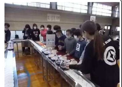
お寿司屋さん体験ゲーム

SDGsを体験から学ぶ 21日（火）の3・4校時に、4・5・6年生は、体育館で「くら寿司出張授業/お寿司で学ぶSDGs」を行いました。「お寿司の食べられなくなる未来を変えよう」のテーマで、「低利用魚」や「食品ロス」の問題を体験を通して学びました。お寿司屋さん体験などもあり、楽しみながら身近な問題を考えることができました。