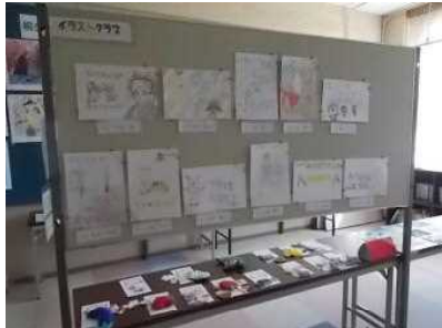
クラブ活動展示 （イラストクラブ）