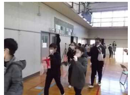
6年生：カメラに手を振って退場しました。