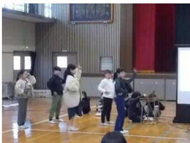
5年生：大感謝祭のダンス楽しいさが伝わりました。