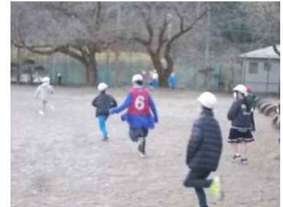
1/13 たてわり活動 (赤団)