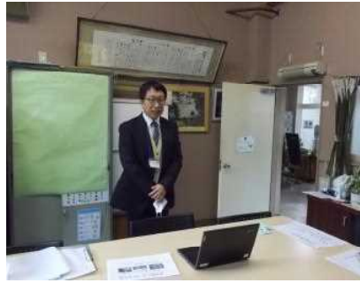
1 / 1 0 始業式