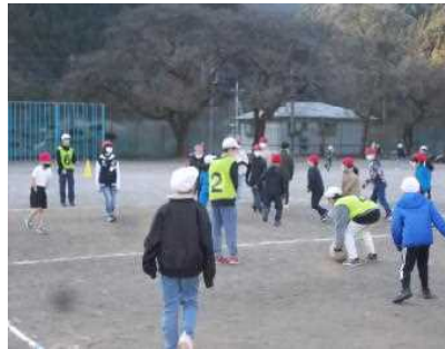
1/13 たてわり活動 (黄色団)