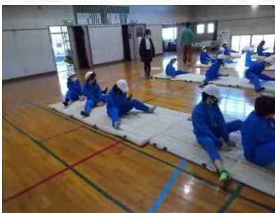
1/17 開脚前転練習 (5年体育)