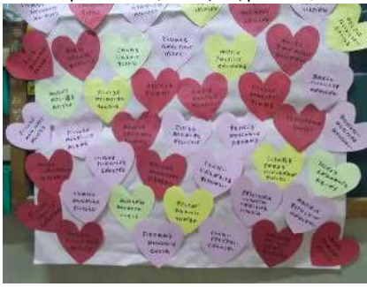
1 2 月 人権標語