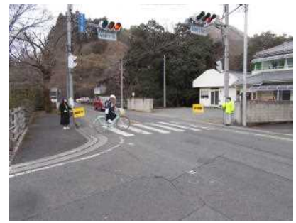
1/10 交通安全協会女性部 立哨指導