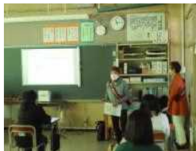
1/17薬物乱用防止教室 梅田地区更生保護女性会