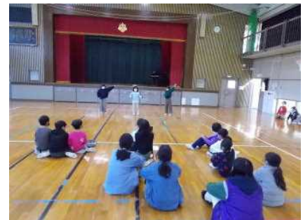
1/17 特技集会 オーディション