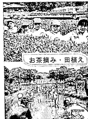
お茶摘み・田植え

が30分程遅くなる方向をお伝えしましたが、今後、国や県・市の動向や決定に合わせ、本校に一番あった形を再検討し、お伝えしていきたいと思ひます。ご理解のほど、よろしくお願いいたします。