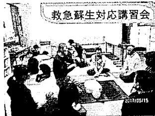
救急蘇生対応講習会

学校では、5月、万が一の事故等に備え、救急蘇生対応講習会を開き、消防署の方を講師として、全教職員で参加しました。子どもたちの豊かな教育活動、そして新たなチャレンジを支えてくださるすべての皆さんに感謝申し上げます。今年も、自分のめあてにむげがんばる子どもたちです。